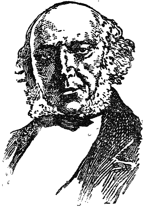
हरबर्ट स्पेन्सर ( १८२०-१९०३ )